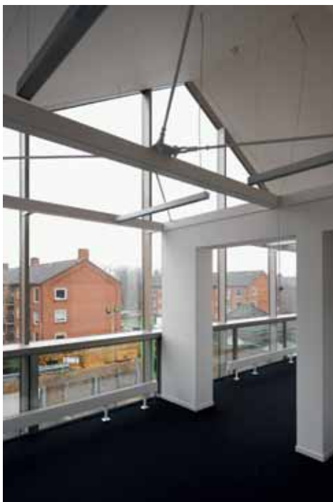
BOVEN LINKS Kantoorruimte in de ingekorte voormalige verpleegstersvleugel boven de Bloedbank